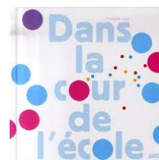
Dans la cour de l'école de Christophe LOUPY