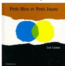
Petit-Bleu et Petit-Jaune de Léo LIONNI