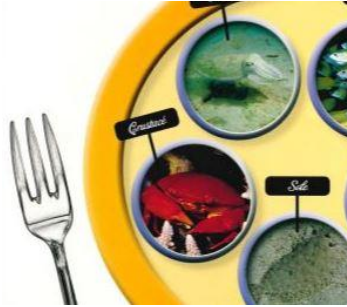
photographie de fourchette pour évoquer le régime alimentaire de l'animal