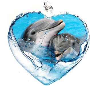
forme de cœur pour illustrer les relations entre la mère et son petit

➔ Le travail sur les constantes des documentaires pourra être réinvesti dans des activités de tri de textes, l'objectif principal étant d'amener les élèves à différencier textes narratifs et textes informatifs.