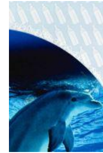
motif de biberons sur la page qui traite de l'allaitement chez les mammifères