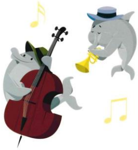
illustrations personnifiant le dauphin (cf. littérature jeunesse)

2. Quelques illustrations ou choix de mise en page relèvent de l'anthropomorphisme. Il est important d'attirer l'attention des élèves sur ce point.